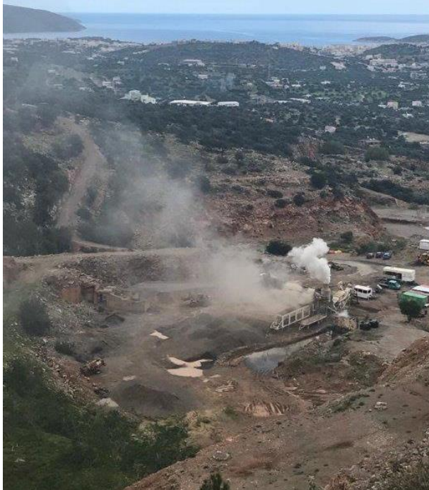
Φωτογραφία Νοτιοδυτικά της εγκατάστασης ακριβώς πάνω από τα πρνή του ανενεργού λατομείου