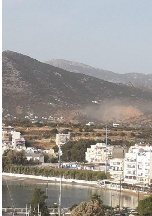
Φωτογραφία Βορειοανατολικά της εγκατάστασης από τον λόφο της Περιφέρειας