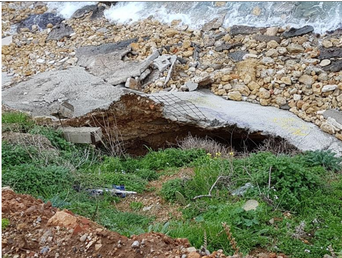
Φωτογραφία σελ. 141 της Μ.Π.Ε.

Στην περιοχή που πρόκειται να προστατευθεί από την θάλασσα διάβρωση με τα προτεινόμενα έργα βρίσκονται σημαντικές εγκαταστάσεις και δίκτυα της ΔΕΥΑΧ που γειτνιάζουν με το μέτωπο