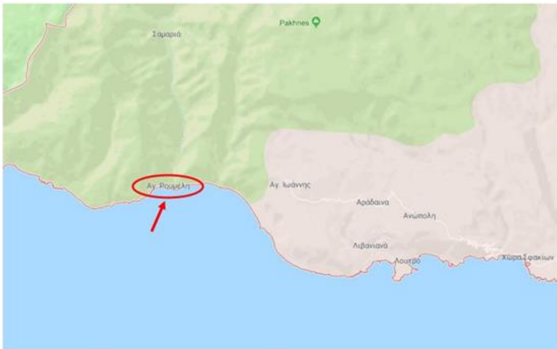
Εικόνα 2 : Δήμος Σφακίων – Θέσεις των υπό εξέταση Λιμενικών Υποδομών. (σελ.2 Εισαγωγή της Μ.Π.Ε.).