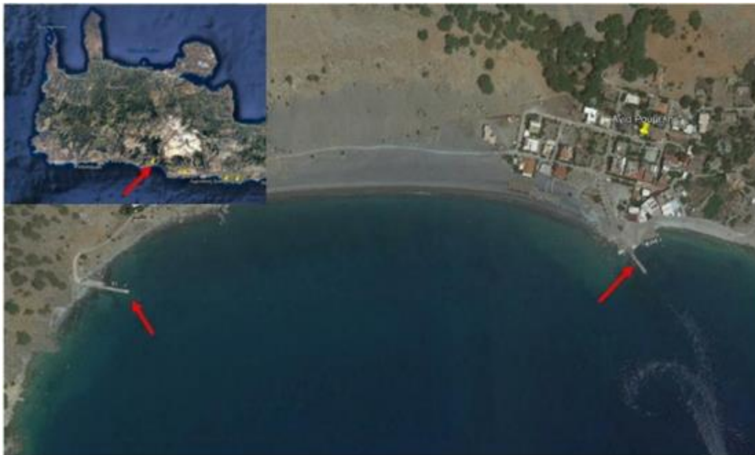
Εικόνα 3: Δορυφορική φωτογραφία των λιμενικών υποδομών της Αγίας Ρούμελης. (σελ.3 της Μ.Π.Ε.), και σελ. 10 της Μελέτης Ακτομηχανικής Διερεύνησης των Λιμενικών Υποδομών Αγίας Ρούμελης.