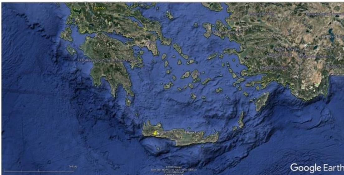
Εικόνα1 : Γεωγραφική θέση όρμου Αγίας Ρουμέλης, Ν. Σφακίων.