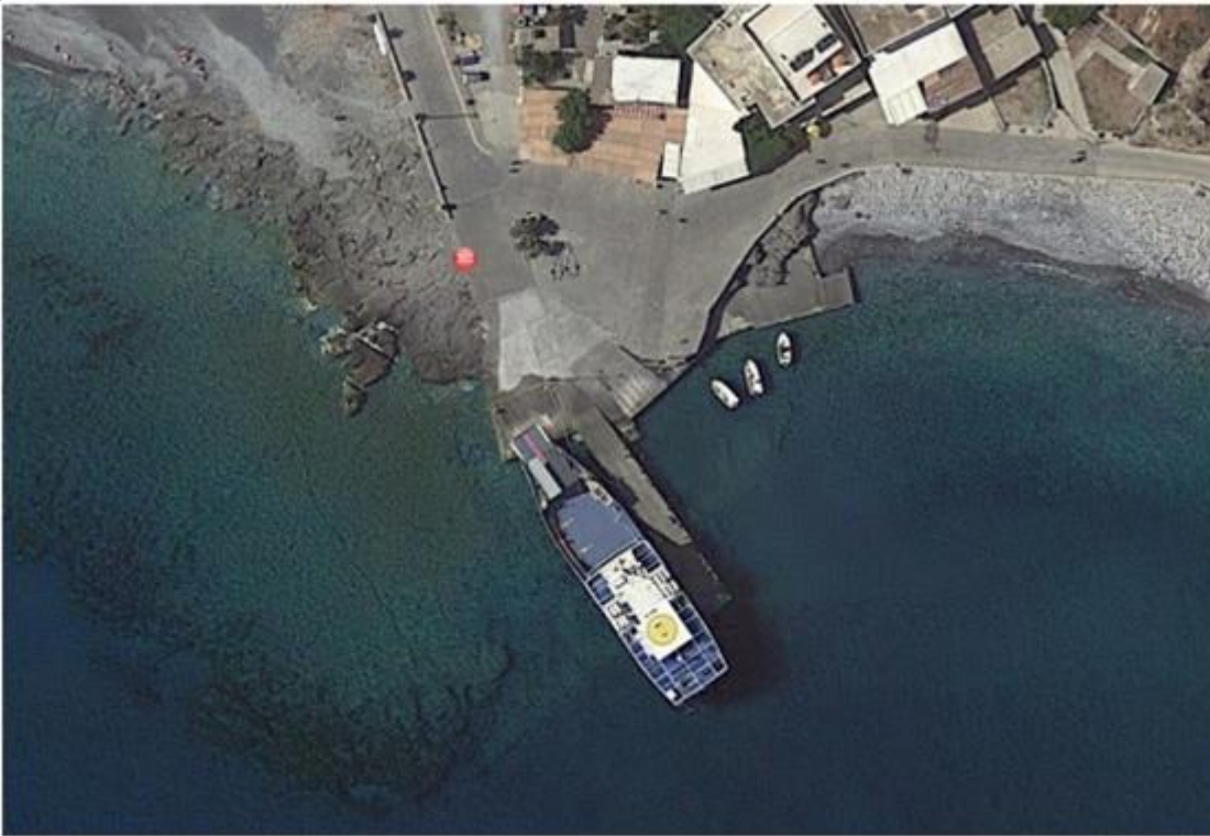
Εικόνα 5: Λιμενική υποδομή Αγίας Ρουμέλης (σελ.9 της Μ.Π.Ε.).

Σύμφωνα με τη μελέτη «Κατασκευή ράμπας εξυπηρέτησης Ε/Γ – Ο/Γ πλοίων στην Αγία Ρουμέλη Δήμου Σφακίων», μετά από διερεύνηση των καιρικών συνθηκών, αφού εξετάσθηκε η μορφολογία του βυθού και της ακτής και κατόπιν συνεννοήσεων με τους χρήστες το έργο που προτείνεται αφορά στην επέκταση της ράμπας που υπάρχει στη δυτική πλευρά του υφιστάμενου προβλήτα υπό γωνία (με αλλαγή κατεύθυνσης) και για μήκος 20,00 μέτρων