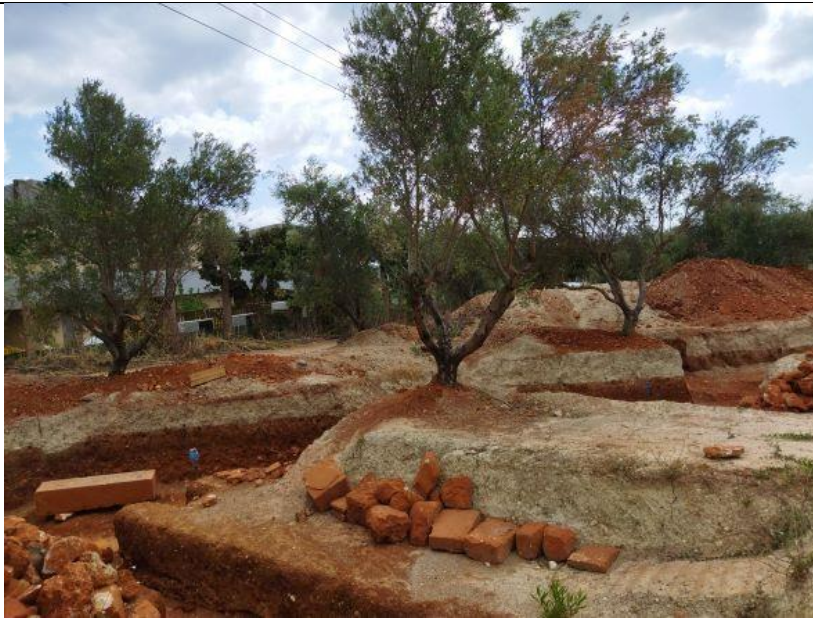
Φωτ. 2. Ανασκαφική έρευνα από την εφορεία αρχαιοτήτων