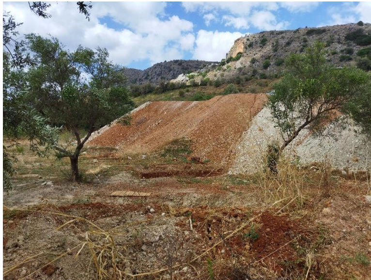
Φωτ. 1. Επίχωση στο σημείο που θα γίνει η νέα κυκλοφοριακή σύνδεση.

Για τις ανάγκες της γνωμοδότησης πραγματοποιήθηκε αυτοψία στο γήπεδο ανέγερσης του νέου ξενοδοχείου, το οποίο έχει εκχερσωθεί και βρίσκεται σε εξέλιξη ανασκαφική έρευνα από την Εφορεία Αρχαιοτήτων. Διαπιστώθηκε ότι στο σημείο που πρόκειται να γίνει η νέα κυκλοφορική σύνδεση έχουν εναποτεθεί προϊόντα εκσκαφής, προκειμένου να ανέλθει το επίπεδο του γηπέδου στο ύψος της παλαιάς εθνικής οδού. Η Εφορεία Αρχαιοτήτων έχει ζητήσει την απομάκρυνση των εν λόγω επιχώσεων στην με αρ. πρωτ. 355838/30-07-2021 γνωμοδότησή της. Επίσης, διαπιστώθηκε ότι στο όριο με το υφιστάμενο ξενοδοχείο υπάρχει πρόχειρη περίφραξη με πλέγμα και δίκτυ καθώς και πόρτα, ώστε να υπάρχει επικοινωνία των δύο γηπέδων. Τέλος, διαπιστώθηκε ότι έχει μειωθεί το ύψος των κυπαρισσιών στο όριο του νέου γηπέδου με την υφιστάμενη ξενοδοχειακή μονάδα.