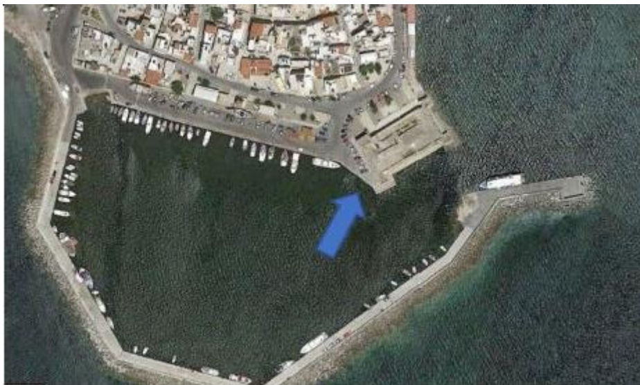
Θέση που προβλέπονται οι χερσαίες εγκαταστάσεις του υδατοδρομίου, εμπροσθεν του φρουρίου Καλέ