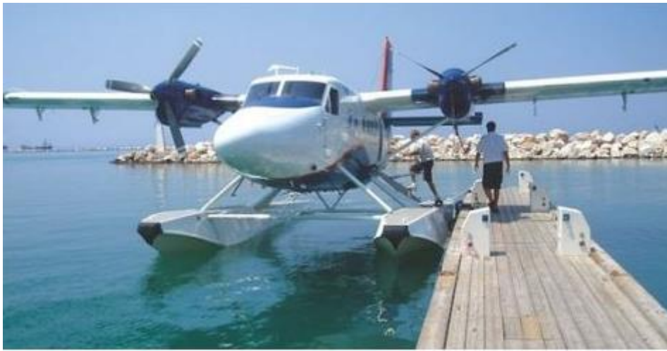
Ενδεικτική φωτογραφία υδροπλάνου σε πρόσδεση και πλωτού προβλήτα

Ως προς το νομικό κομμάτι της αδειοδότησης υδατοδρομίων ισχύει: