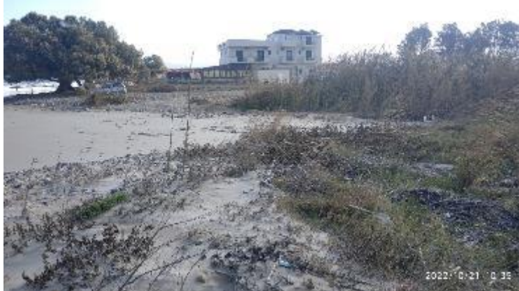
Εικ. 14 και 15: ο υγρότοπος η εκβολή του ρέματος Μηλιά (Κακοπέρατος) εντός της ιδιοκτησίας της εταιρείας «ΙΚΟΣ ΚΙΣΣΑΜΟΣ ΜΟΝΟΠΡΟΣΩΠΗ ΑΝΩΝΥΜΗ ΕΤΑΙΡΕΙΑ ΞΕΝΟΔΟΧΕΙΑΚΩΝ ΕΠΙΧΕΙΡΗΣΕΩΝ», από την αυτοψία της υπηρεσίας μας στις 21-10-2022