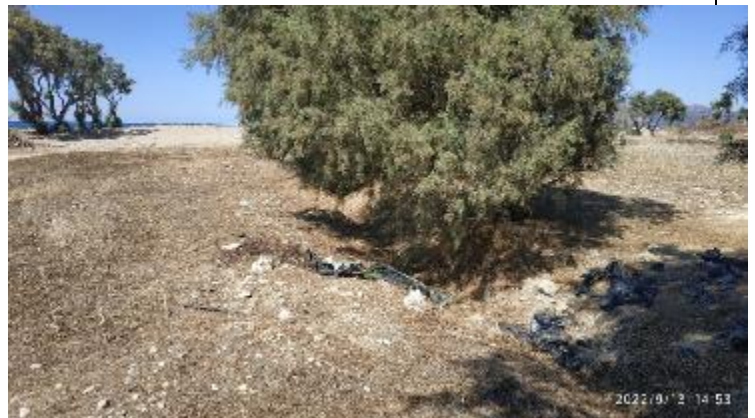
Εικ. 12 και 13: Παλαιοί αύλακες αποστράγγισης εντός του αγροτεμαχίου εμβαδού 203.222,29m 2 της εταιρείας «ΙΚΟΣ ΚΙΣΣΑΜΟΣ ΜΟΝΟΠΡΟΣΩΠΗ ΑΝΩΝΥΜΗ ΕΤΑΙΡΕΙΑ ΞΕΝΟΔΟΧΕΙΑΚΩΝ ΕΠΙΧΕΙΡΗΣΕΩΝ» το οποίο χρησιμοποιούταν ως για χρήση αγροτικών καλλιεργειών, από την αυτοψία της υπηρεσίας μας στις 13-9-2022

Όσον αφορά στην αντιπλυμμηρική προστασία του έργου, στη ΜΠΕ (κεφ.10.12.2) γίνεται αναφορά για τη κατασκευή συστημάτων αποχέτευσης ομβρίων (τάφροι, δίκτυο κ.λπ.) χωρίς όμως να περιγράφονται αναλυτικά τα έργα που θα κατασκευαστούν και χωρίς να επισυνάπτεται σχετικό σχέδιο με την διάταξη αυτών. Κατά την άποψη της υπηρεσίας μας, θα πρέπει να προσδιοριστούν αναλυτικά στη ΜΠΕ τα αντιπλυμμηρικά έργα και έργα αποστράγγισης ομβρίων που πρέπει να πραγματοποιηθούν, καθώς και ο αποδέκτης.