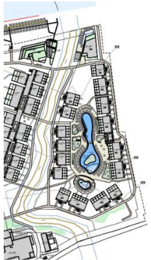
Εικ. 16: Οι γέφυρες για τη σύνδεση των 2 τμημάτων της ιδιοκτησίας της εταιρείας «ΙΚΟΣ ΚΙΣΣΑΜΟΣ ΜΟΝΟΠΡΟΣΩΠΗ ΑΝΩΝΥΜΗ ΕΤΑΙΡΕΙΑ ΞΕΝΟΔΟΧΕΙΑΚΩΝ ΕΠΙΧΕΙΡΗΣΕΩΝ», σύμφωνα με το masterplan της ΜΠΕ (σχέδιο Α.1.1).

Συνεπώς, κατά τη φάση κατασκευής και λειτουργίας της τουριστικής δραστηριότητας οφείλουν να τηρηθούν οι παραπάνω περιορισμοί για τον προστατευόμενο υγρότοπο Y434KRI221 «Εκβολή ρέματος Μηλιά (Κακοπέρατος).