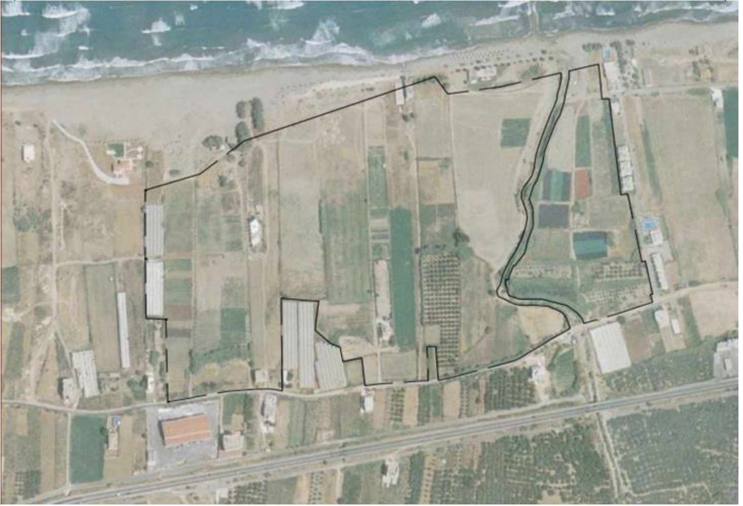
Εικόνα 1: Αεροφωτογραφία από το Google Earth (ΜΠΕ σελ. 7) της έκτασης του προγραμματιζόμενου έργου: «κατασκευή και λειτουργία νέου κυρίου ξενοδοχειακού καταλύματος 5* δυναμικότητας 1280 κλινών στη θέση «Κάμπος-Λειβάδεια» του Δήμου Κισσάμου Π.Ε. Κισσάμου Π.Ε. Χανίων» της εταιρείας «IKOS KISSAMOS ΜΟΝΟΠΡΟΣΩΠΗ ΑΝΩΝΥΜΗ ΕΤΑΙΡΕΙΑ ΞΕΝΟΔΟΧΕΙΑΚΩΝ ΕΠΙΧΕΙΡΗΣΕΩΝ».

Στη νότια πλευρά χωροθετείται επίσης και η μονάδα επεξεργασίας υγρών αποβλήτων και η κεντρική εγκατάσταση αερίου. Στη νότια πλευρά του γηπέδου θα είναι η κεντρική είσοδος προς το συγκρότημα, που περιλαμβάνει το φυλάκιο εισόδου καθώς και χώρο στάθμευσης οχημάτων επισκεπτών - φιλοξενουμένων, εργαζομένων και ηλεκτρικά οχήματα για την εσωτερική κίνηση εντός συγκροτήματος. Στη ίδια πλευρά χωροθετείται και η μονάδα επεξεργασίας υγρών αποβλήτων και η κεντρική εγκατάσταση αερίου. Στη νότια πλευρά του γηπέδου θα είναι η κεντρική είσοδος προς το συγκρότημα, που περιλαμβάνει το φυλάκιο εισόδου καθώς και χώρο στάθμευσης οχημάτων επισκεπτών - φιλοξενουμένων, εργαζομένων και ηλεκτρικά οχήματα για την εσωτερική κίνηση εντός συγκροτήματος. Η πρόσβαση στην είσοδο του γηπέδου από τον ΒΟΑΚ, πραγματοποιείται από παράπλευρη αυτού δημοτική οδό, η οποία συνδέεται στον πλησιέστερο κόμβο του Κορφαλώνα.