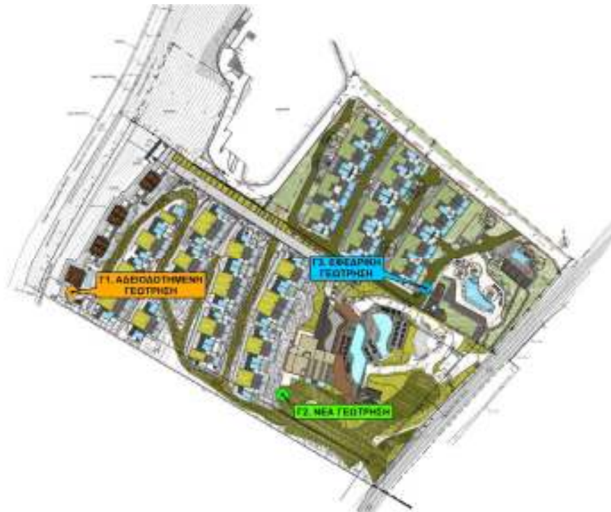
Εικόνα 2 Διάγραμμα Κάλυψης (Υφιστάμενης & Νέας Ξενοδοχειακής Μονάδας)