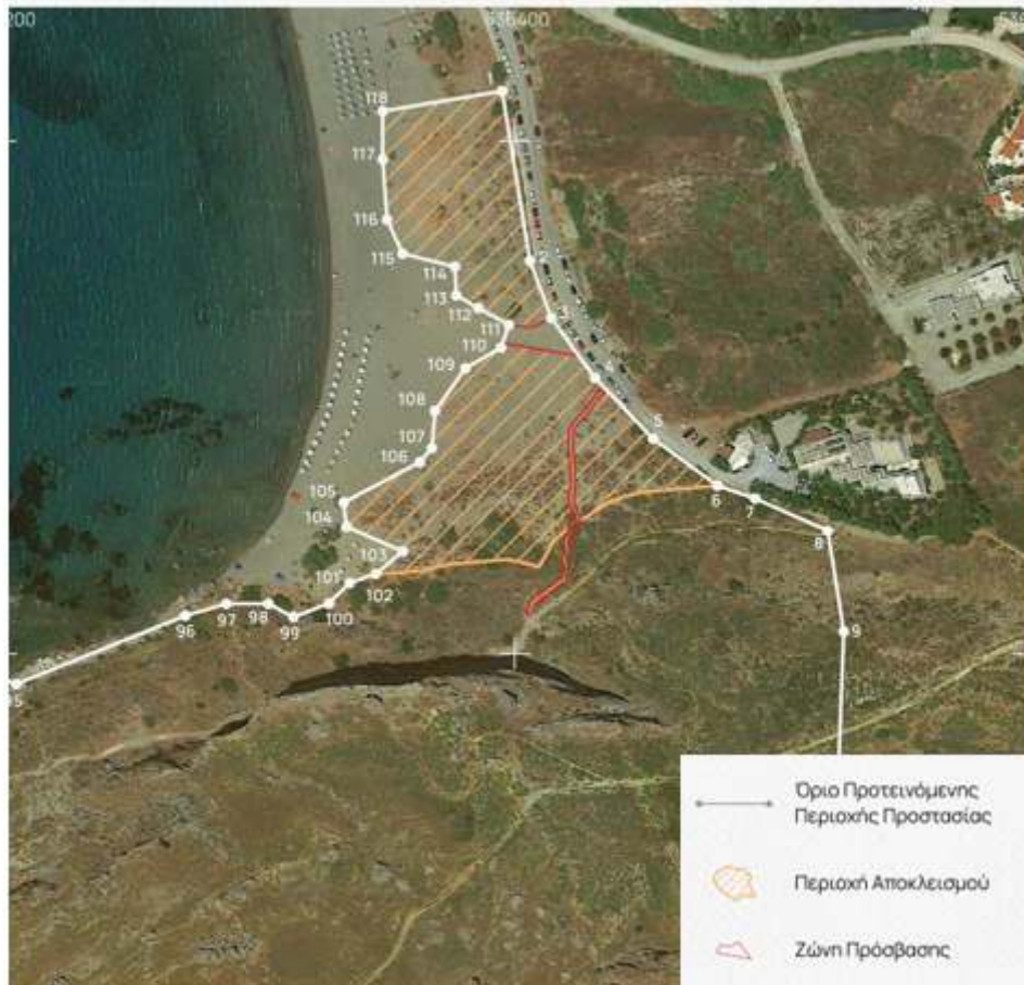
Χάρτης 4: Τμήμα της περιοχής προς χαρακτηρισμό, με τη Ζώνη Αποκλεισμού για την προστασία των αμμοθινών και τις δύο Ζώνες Πρόσβασης.