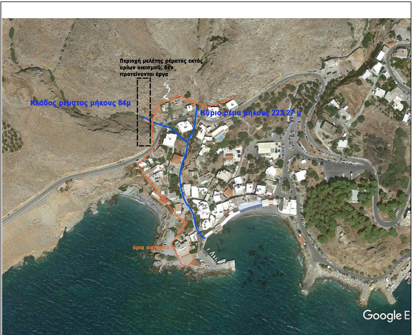
Εικόνα 1: Δορυφορική θέση ρέματος (2 κλάδοι: κύριος 223,27μ - κλάδος 84μ), αποτύπωση ορίων οικισμού και επισήμανση περιοχής μελέτης ρέματος εκτός οικισμού στην οποία δεν προτείνονται έργα.

Οι συντεταγμένες κατά ΕΓΣΑ 87 των κορυφών οριοθέτησης βρίσκονται στον επόμενο πίνακα (Κ1 –Κ65).