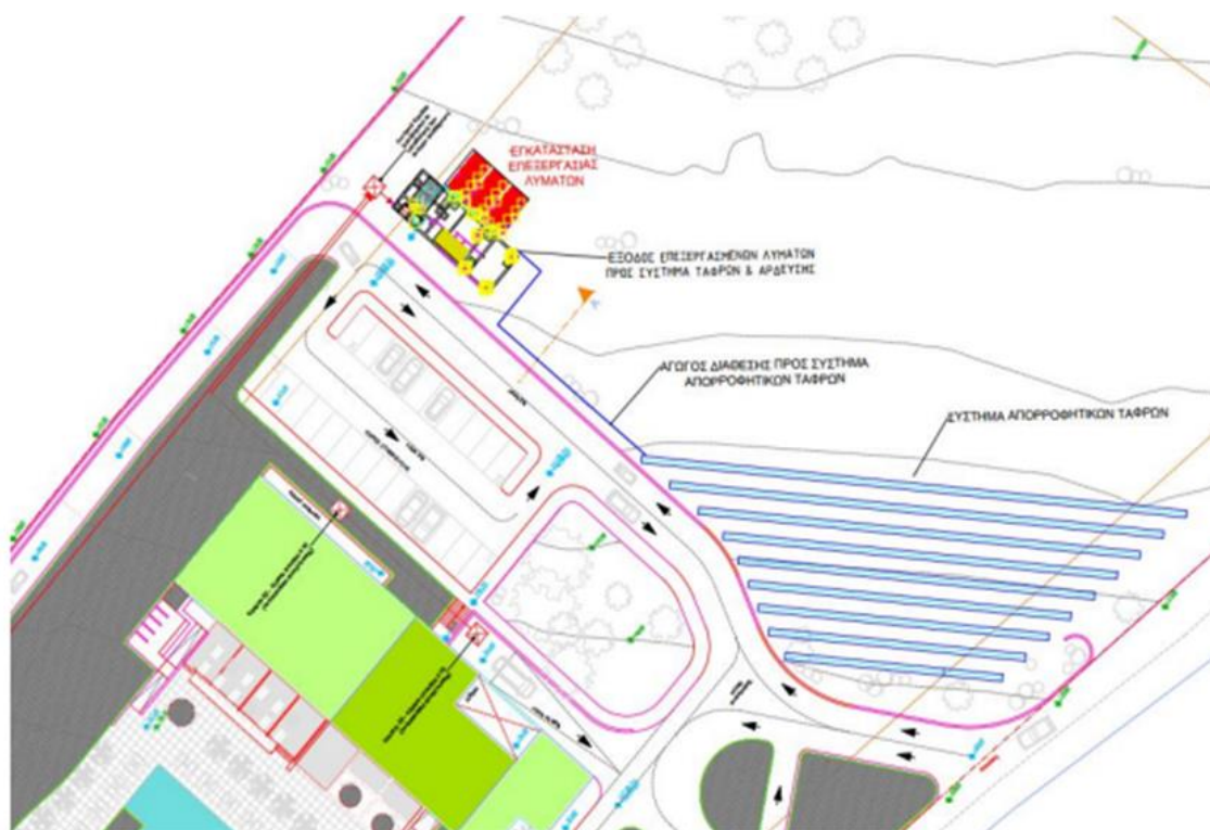
Εικόνα 6-9 Γενική Διάταξη ΕΕΛ