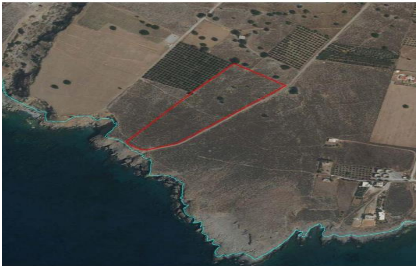
Εικόνα 1: Δορυφορική εικόνα της θέσης του γηπέδου όπου προτείνεται να κατασκευαστεί η Ξενοδοχειακή μονάδα.

Η πρόσβαση γίνεται από τη δημοτική οδό πλάτους 8,00μ., η οποία διατρέχει το γεωτεμάχιο κατά μήκος της νοτιοανατολικής πλευράς του.