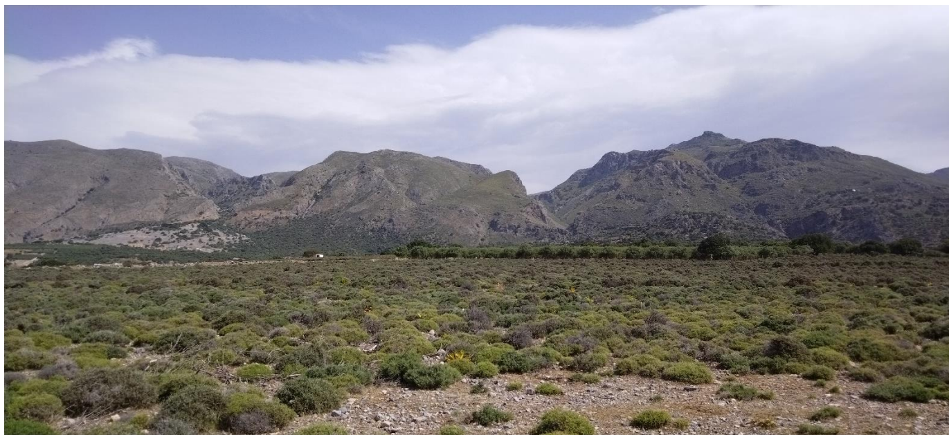
Εικόνα 2: Φωτογραφία του γεωτεμαχίου όπου προτείνεται να κατασκευαστεί η Ξενοδοχειακή μονάδα (ημέρα αυτοψίας, 16-5-2023).