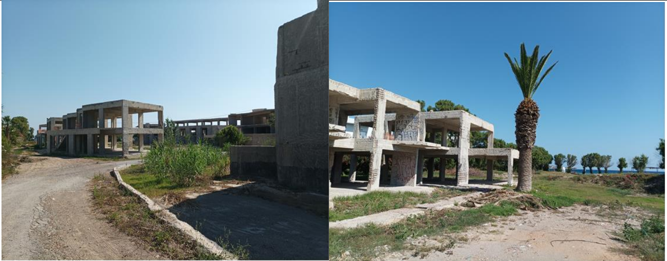
Φωτογραφία 1 – 22/6/2023