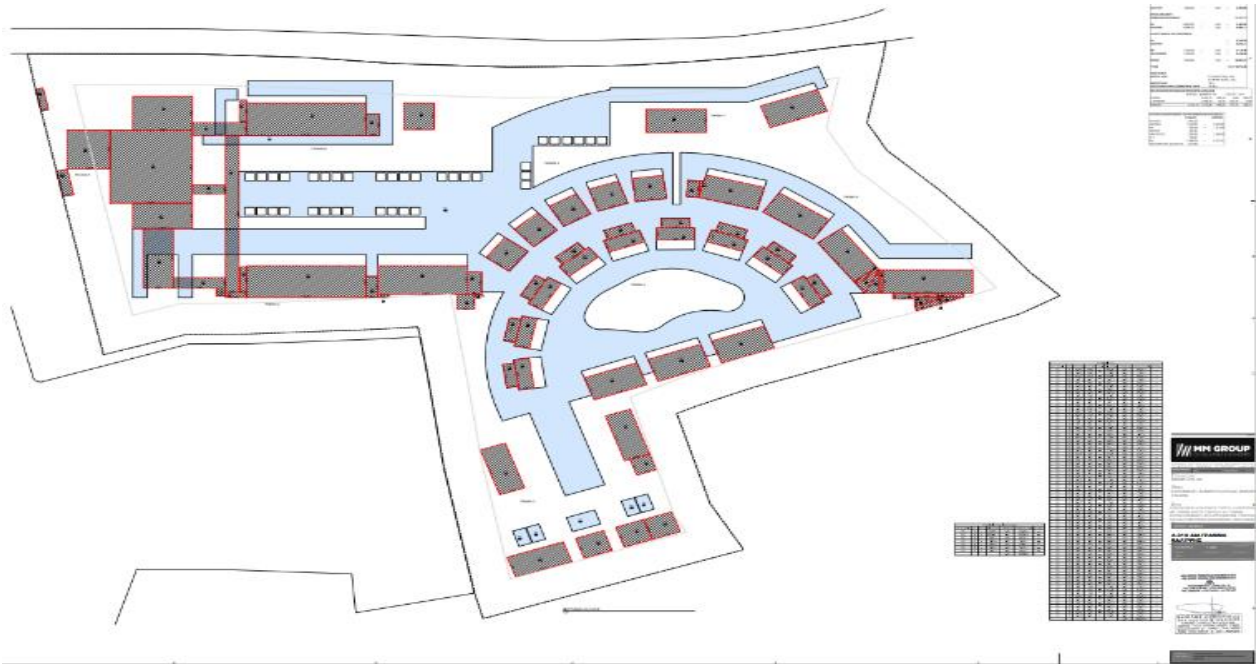
Εικ.2: Το διάγραμμα κάλυψης (σχέδιο Α-010 της ΜΠΕ) του νέου ξενοδοχειακού συγκροτήματος 298 κλινών, στη θέση Λίμνες, Δ.Δ. Κολυμβαρίου, Δήμου Πλατανιά, Νομού Χανίων της εταιρείας «ΜΙΝΩΑ ΞΤΕ Α.Ε.»