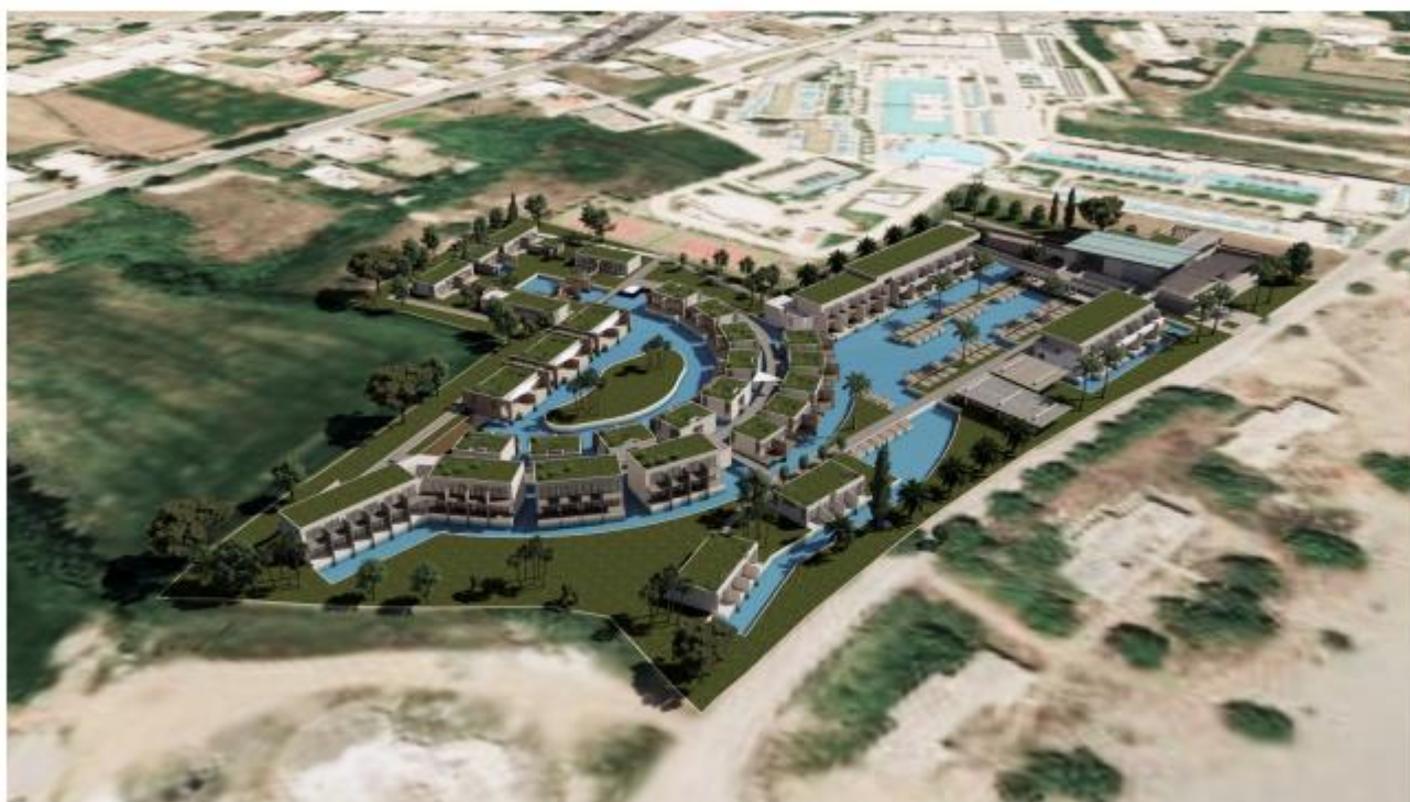
Φωτορεαλιστική Απεικόνιση Έργου Κατεύθυνση ΝΔ

Η ημερήσια ποσότητα απορροής λυμάτων της μονάδας εκτιμάται από 280 μέχρι 450 l/άτομο/ημέρα, που για τη δυναμικότητα του ξενοδοχείου συνεπάγεται στα 83,5 με 134,1 m 3 /ημέρα. Το ξενοδοχείο θα διαθέτει τα λύματα του σε αγωγό λυμάτων της ΔΕΥΑΒΑ που διέρχεται στην δημοτική οδό στο βόρειο σύνορο του γηπέδου. Η ημερήσια ποσότητα νερού άρδευσης του ξενοδοχείου για τον περιβάλλον χώρο του, εκτιμάται στα 5,0 m 3 /στρέμμα/ημέρα. Η συνολική έκταση της αρδευόμενης περιοχής εκτιμάται στα 10 στρέμματα περίπου και η συνολική ποσότητα νερού άρδευσης του ξενοδοχείου εκτιμάται στα 50 m 3 /ημέρα . Το γήπεδο του ξενοδοχείου, όπως αναφέρεται στη ΜΠΕ, θα τροφοδοτείται με νερό άρδευσης από χωριστό δίκτυο που διέρχεται στα όρια της ιδιοκτησίας.