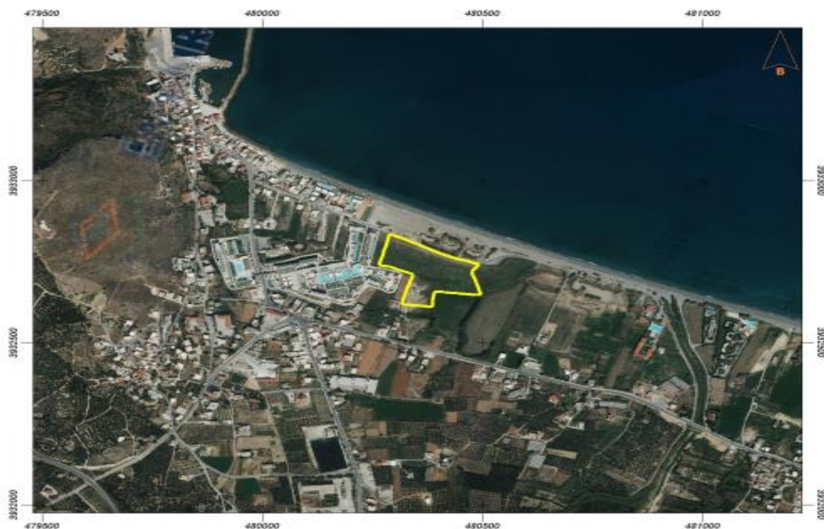
Εικ.1: Η έκταση του υπό μελέτη του έργου «Ξενοδοχείο κλασσικού τύπου, 5 αστέρων, με τμήμα εκτός σχεδίου και εντός οικισμού, δύο ορόφων με υπόγειο και κολυμβητικές δεξαμενές, 298 κλινών, στη θέση Λίμνες, Δ.Δ. Κολυμβαρίου, Δήμου Πλατανιά, Νομού Χανίων από

Σύμφωνα με τη ΜΠΕ (σελ. 59) η δόμηση της νέας μονάδας θα ανέρχεται στα 5.536,08 τ.μ. , με κάλυψη 5.086,04 τ.μ. και 993,00 τ.μ. ημιυπαίθριους χώρους, 535,35 τ.μ. εξώστες, 2.410,10 τ.μ. υπόγειους χώρους και 7.353,98 τ.μ. κολυμβητικές δεξαμενές. Όπως αναφέρεται στη ΜΠΕ (κεφ.6, σελ. 66), το κεντρικό διώροφο κτίριο της μονάδας θα τοποθετηθεί στο δυτικό όριο αυτής, θα περιλαμβάνει κοινόχρηστες λειτουργίες και θα αποτελεί τη μετάβαση από το υφιστάμενο ξενοδοχείο «AVRA IMPERIAL» στο νέο. Στο ισόγειο τοποθετείται υποδοχή με σαλόνι, χώρος εστιατορίου, χώροι παρασκευαστηρίου καθώς και τα κοινόχρηστα wc. Μέσω ράμπας γίνεται η πρόσβαση στον δεύτερο όροφο. Η ράμπα θα καταλήγει σε ανοικτό, στεγασμένο χώρο με θέα προς τη θάλασσα, όπου θα αναπτύσσονται τραπεζοκαθίσματα. Θα δημιουργηθεί επίσης χώρος παρασκευαστηρίου και ένας κλειστός χώρος με ανοιγόμενα υαλοστάσια για καθημένους πελάτες. Μέσω ανοικτών κλιμάκων, γίνεται η κατάβαση προς τη δημοτική οδό και την παραλία. Κατά μήκος της δημοτικής οδού δημιουργείται διώροφο κτίσμα, στο οποίο τοποθετούνται δωμάτια με τις ιδιωτικές πισίνες τους και οι αντίστοιχοι κοινόχρηστοι διάδρομοι και τα κλιμακοστάσια. Κάτω από τη στάθμη του εδάφους, στο υπόγειο θα αναπτύσσονται οι βοηθητικοί χώροι του ξενοδοχείου (Εικόνα 4, φωτορεαλιστική απεικόνιση).