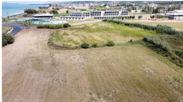
Εικ.6 και 7: Παλιός αποστραγγιστικός χάνδακας εντός της έκτασης του νέου ξενοδοχείου στη θέση Λίμνες, Δ.Δ. Κολυμβαρίου, Δήμου Πλατανιά Χανίων της εταιρείας «ΜΙΝΩΑ ΞΤΕ Α.Ε.» από την αυτοψία της υπηρεσίας μας στις 1-6-2023 (ΑΡΙΣΤΕΡΑ) και από φωτογραφίες από τη ΜΠΕ σελ. 195 (ΔΕΞΙΑ).