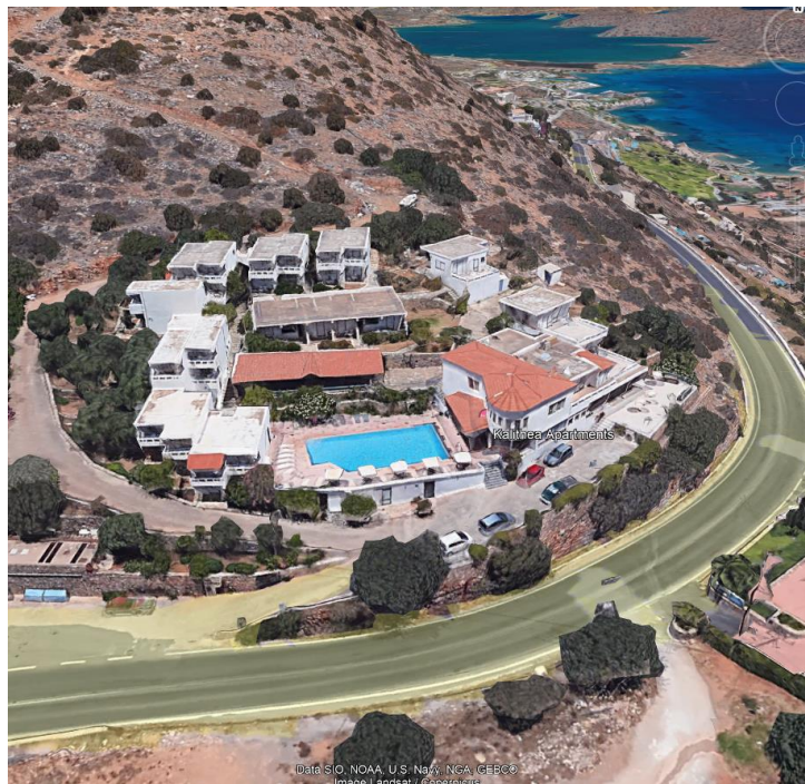
Εικόνα 2. Παλαιότερη άποψη της υφιστάμενης ξενοδοχειακής μονάδας

Το έργο αφορά στη λειτουργική αναβάθμιση του υφιστάμενου ξενοδοχείου από 2* σε 5* με κατασκευή νέων κτιρίων και αύξηση της δυναμικότητας των κλινών από 72 σε 120, σε συνολικό εμβαδόν γηπέδου 15.433,71 τ.μ. μετά την προσθήκη όμορου οικοπέδου.