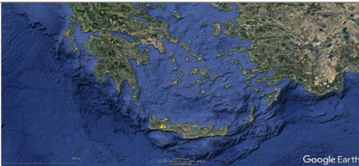
Εικόνα1 : Γεωγραφική θέση Αγίας Ρουμέλης, Ν. Σφακίων.