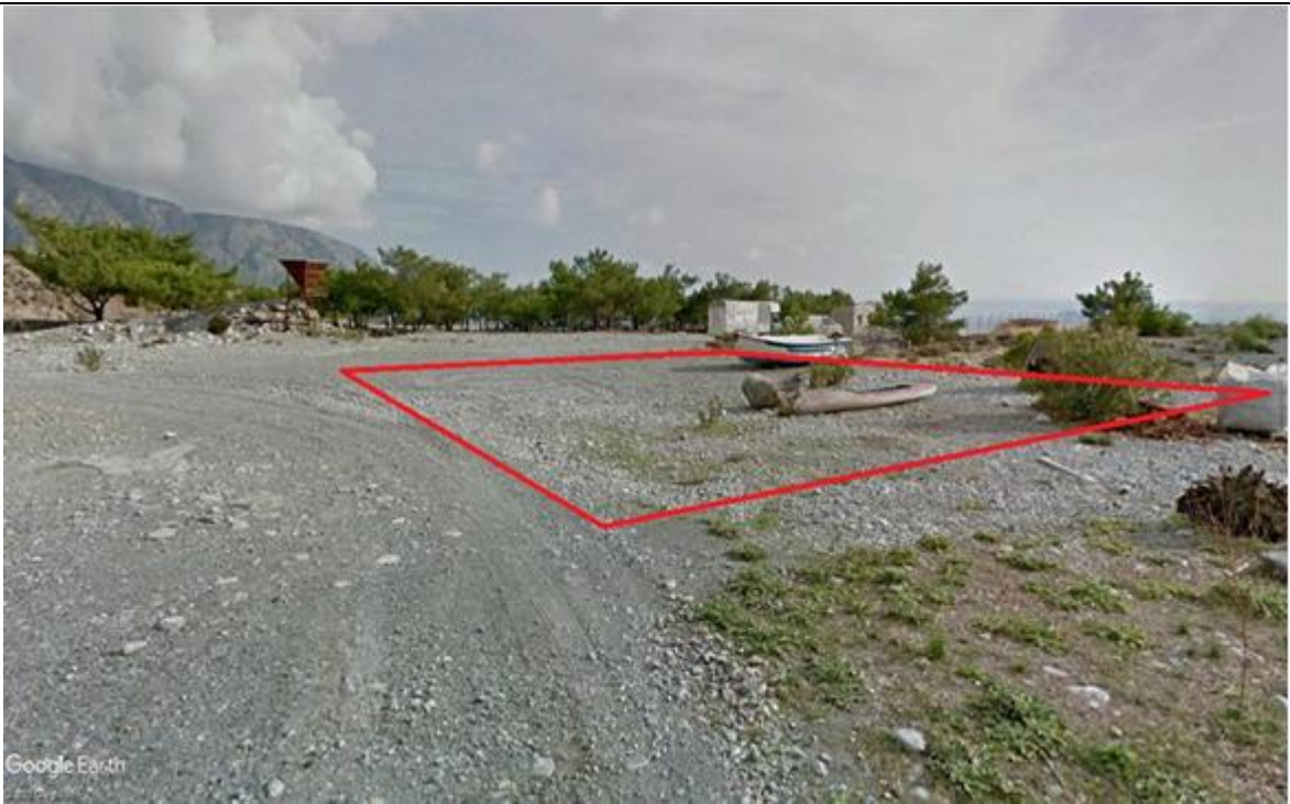
Φωτογραφία 2: Άποψη του γηπέδου της Ε.Ε.Λ., με λήψη από δυτικά προς ανατολικά. (σελ.194 της Μ.Π.Ε.).