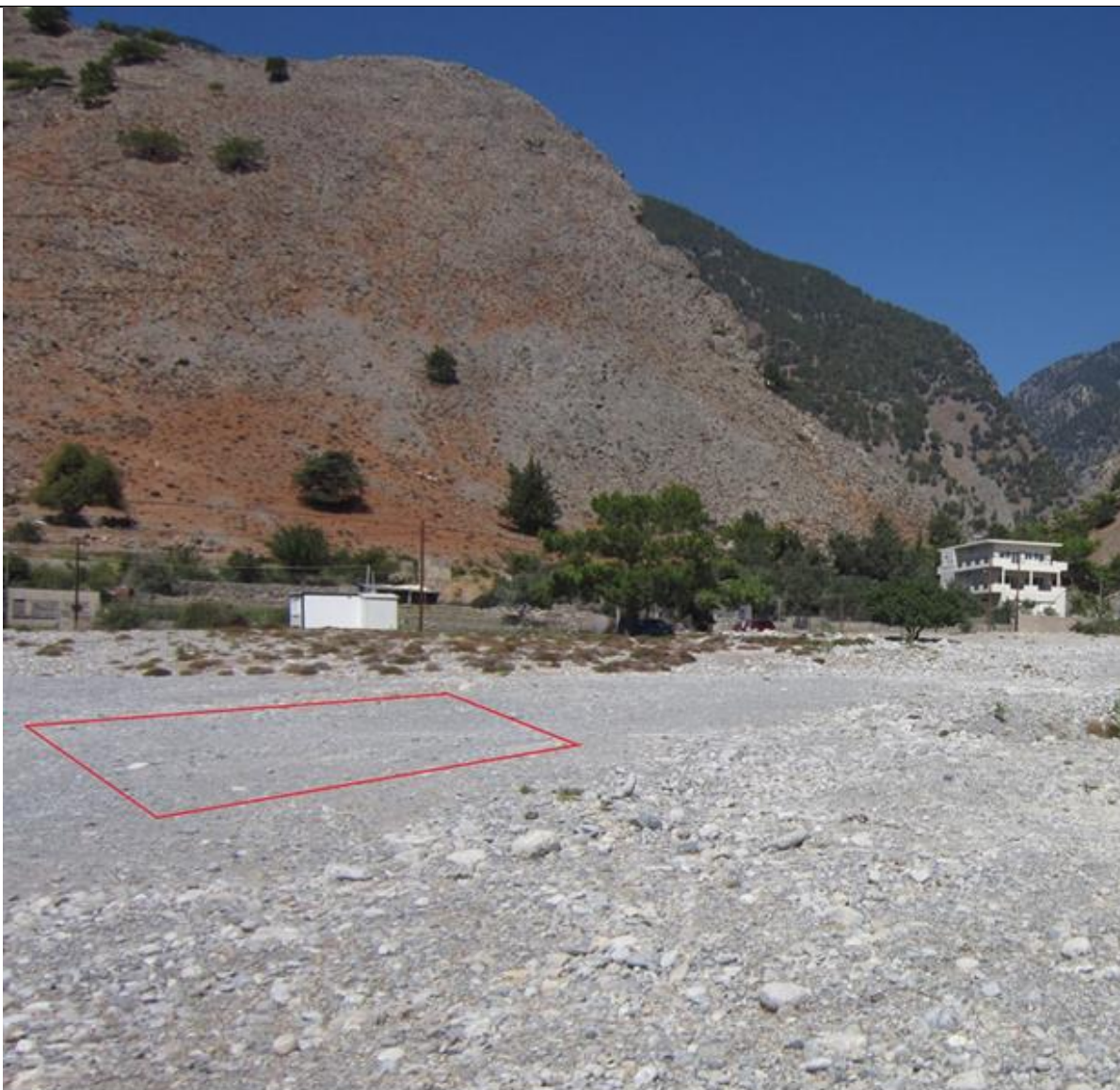
Φωτογραφία 4 : Απεικόνιση του χώρου κατασκευής του νέου απορροφητικού βόθρου. Λήψη φωτογραφίας ανατολικά-δυτικά. (σελ.197 της Μ.Π.Ε.).