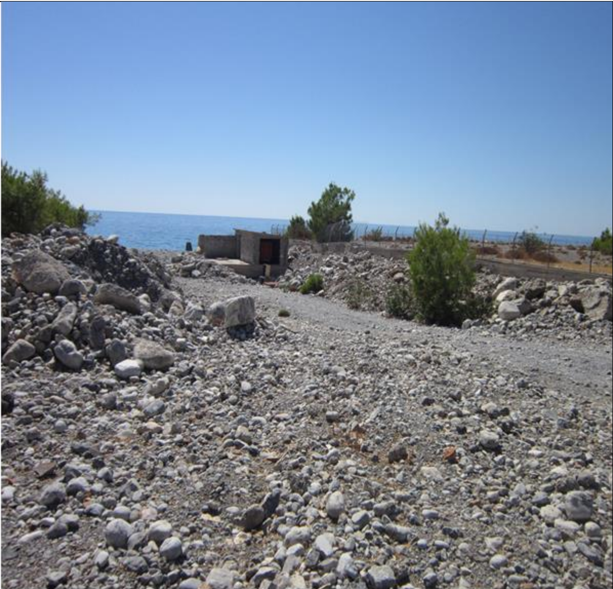
Φωτογραφία 3: Άποψη της θέσης του Αντλιοστασίου. Λήψη της φωτογραφίας από τα βόρεια προς νότια. (σελ.195 της Μ.Π.Ε.).