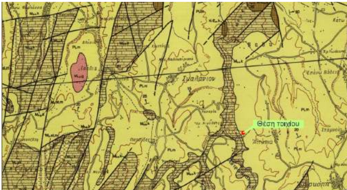
Εικόνα 2: Απόσπασμα Γεωλογικού χάρτη ΙΓΜΕ, φύλλο Ηράκλειο, Κλίμακα 1:50.000 με σημειωμένη τη θέση του έργου

Η ευρύτερη περιοχή του έργου, σύμφωνα με τον Γεωλογικό χάρτη ΙΓΜΕ, φύλλο Ηράκλειο, Κλίμακα 1:50.000, δομείται από Νεογενείς σχηματισμούς της Φοινικιάς (Pl 1m ): λευκές μάργες, μαργαϊκοί ασβεστόλιθοι, τεφρωπές άργιλοι κλπ. Απόσπασμα του Γεωλογικού χάρτη ΙΓΜΕ δίνεται στην ακόλουθη εικόνα.