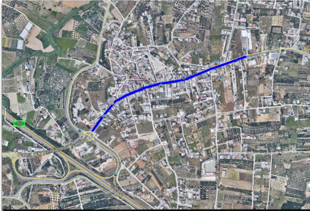
Εικόνα 1: ΠΕΡΙΟΧΗ ΠΑΡΕΜΒΑΣΗΣ

Επίσης, το Δημοτικό Συμβούλιο του Δήμου Μαλεβιζίου γνωμοδότησε θετικά με τη με αρ. 61/2024 Απόφαση με θέμα «Έκφραση γνώμης επί της ΜΠΕ του έργου "Ανάπλαση οδού Βενιζέλου, από Μακεδονίας έως εκκλησία Αγίου Νικολάου, Γάζι"» (αρ. πρωτ. Περιφέρειας 91175/15-3-2024).