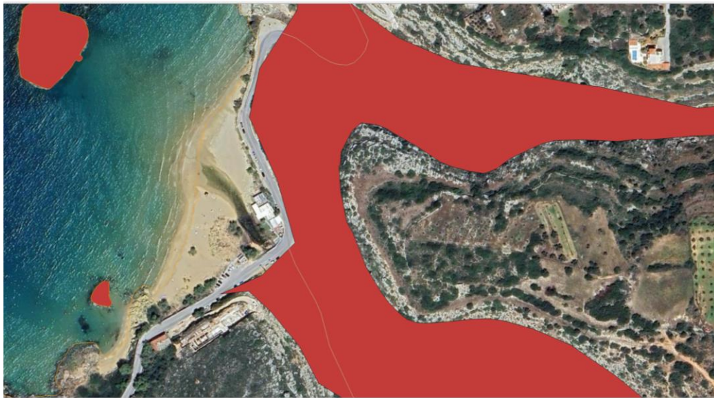
Εικόνα 2. ΠΕΠ-Τ Καλαθά. Εξαίρεση της παραλίας του Καλαθά και της εκβολής του μικρού νησιωτικού υγροτόπου από την ΠΕΠ-Τοπίου

- Ομοίως η ΠΕΠ-Τ6 του Σταυρού περιλαμβάνει τον αρχαιολογικό χώρο του Σταυρού (προσωρινή οριοθέτηση ΦΕΚ 409/ΑΑΠ/2014), τον θεσμοθετημένο υγρότοπο «Σταυρός» [Υ434ΚΡΙ182, σχετ. (7)] και την περιοχή ανάμεσα στον αρχαιολογικό χώρο και τον θεσμοθετημένο υγρότοπο, αφήνοντας εκτός τις δύο παραλίες, οι οποίες συμπεριλαμβάνονται στην ΠΕΠΔ-Τουρισμού.