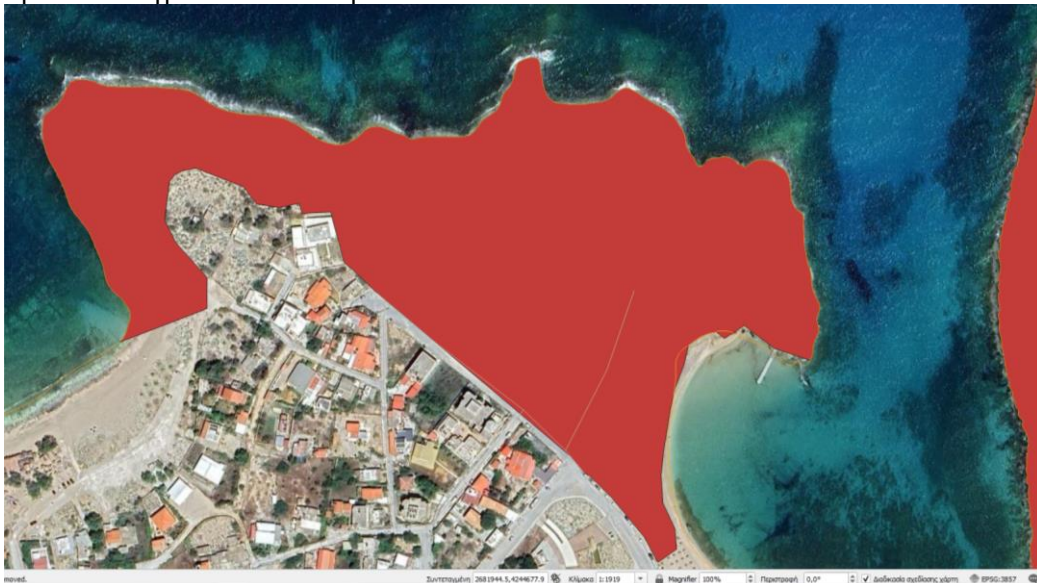
Εικόνα 3. ΠΕΠ-Τ Σταυρού. Εξαίρεση των παραλιών από την ΠΕΠ-Τοπίου

- Επιπλέον, η οριοθέτηση των ΠΕΠ -Τοπίου θα πρέπει να λάβει υπόψη υφιστάμενες τεχνικές υποδομές που υπάρχουν εντός των ορίων τους, όπως τα αντλιοστάσια αποχέτευσης λυμάτων που έχουν κατασκευασθεί στην ΠΕΠ Τ-3 Καλαθάς, ΠΕΠ Τ-4 Λειβάδια Τερσανά και εν γένει την επέκταση δικτύων αποχέτευσης της περιοχής (όπως αυτή έχει εγκριθεί με την σχετ. (12))