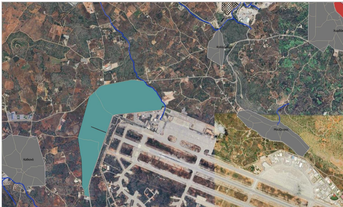
Εικόνα 1. Χωροθέτηση Επιχειρηματικού Πάρκου τύπου Α2, Δυτικά του Αεροδρομίου (Παραγωγικές δραστηριότητες Α2 & Β κατηγορίας)

1.2. Εκτός από τις περιοχές οικιστικής ανάπτυξης, προτείνεται δυτικά του Αεροδρομίου Χανίων και ανατολικά του οικισμού Καθιανών η χωροθέτηση Περιοχής Παραγωγικών Δραστηριοτήτων με τη μορφή Επιχειρηματικού Πάρκου τύπου Α2 του Ν. 4982/22 [σχετ. (5)], όπου θα επιτρέπονται δραστηριότητες σε κατηγορίες περιβαλλοντικής αδειοδότησης Β και Α2. Επίσης, επιτρέπεται η σημειακή χωροθέτηση παραγωγικών δραστηριοτήτων που αφορούν την επεξεργασία τοπικών προϊόντων Α2 και Β κατηγορίας στις ΠΕΠΔ Κτηνοτροφίας και Γεωργίας και οι δραστηριότητες Β κατηγορίας στη ΠΕΠΔ-Περιαστική, χωρίς περιορισμό ως προς το αντικείμενο της δραστηριότητας.