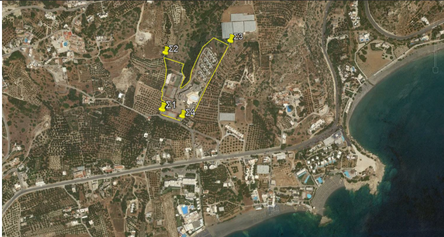
Εικόνα 1. Θέση του έργου.

Το ξενοδοχείο είναι υφιστάμενο και μέχρι το 2023 λειτουργούσε με τον διακριτικό τίτλο «Sunshine Crete Village» και ήταν ιδιοκτησία της «ΠΕΖΑΚΙ Α.Ε.». Πλέον έχει αλλάξει διακριτικό τίτλο (MARE VILLAGE) και έχει περάσει στην ιδιοκτησία της εταιρείας «ΜΑΡΕ Α.Ε.». Το οικόπεδο της μονάδας έχει έκταση 25.493,51m 2 . Βρίσκεται εκτός σχεδίου πόλεως (βρίσκεται 8 km ανατολικά της Ιεράπετρας) και εκτός οικισμού Κουτσουναρίου (απέχει 600m νότια) στη θέση «Καθαράδες - Ρούσσα», με το νότιο όριο του οικοπέδου να εφάπτεται με δημοτική οδό. Το οικόπεδο βρίσκεται εντός του Γ.Π.Σ. Δήμου Ιεράπετρας, σε περιοχή μη χαρακτηρισμένη (ΦΕΚ 530/ΑΑΠ/19-10-2009). Επιπλέον, απέχει 2,4km από την περιοχή NATURA 2000 (SPA) «Νοτιοδυτική Θρυππή-Κουφωτό», 2,4 χλμ από την περιοχή NATURA 2000 (SCI) «Όρος Θρυππή», και βρίσκεται 0,7 χλμ νοτίως του Καταφυγίου Άγριας Ζωής «Αγ. Σαράντα». Ο χαρακτήρας της έκτασης του ακινήτου έχει ως εξής: i) υπάρχουν τμήματα του ακινήτου που δεν περιλαμβάνονται στον κυρωμένο δασικό χάρτη της Π.Ε. Λασιθίου και φέρουν δασική μορφή, ii) τμήματα που περιλαμβάνονται στον κυρωμένο δασικό χάρτη της Π.Ε. Λασιθίου και φέρουν δασική μορφή, iii) τμήματα του ακινήτου που δεν περιλαμβάνονται στον κυρωμένο δασικό χάρτη της Π.Ε. Λασιθίου και φέρουν μη δασική μορφή, και iv) το υπόλοιπο τμήμα του ακινήτου δεν εμπίπτει στις προστατευτικές διατάξεις της δασικής νομοθεσίας.